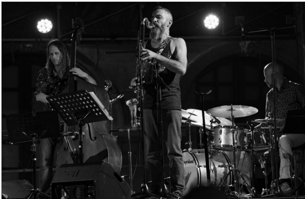
Around Rameau est un collectif dijonnais réunissant des artistes et des enseignants du département jazz du Conservatoire, créé pour le marathon Rameau.

« C'est un petit panel de ce qui se fait dans notre région dans des styles différents », souligne encore Florian Jannot-Caeilleté. Ainsi, le duo